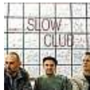
Welcome To The Slow Club (EP) Serious Entertainment/EMI

Das Risiko des Jahrzehnts geht möglicherweise Falcos feinsinniger Mastermind Markus Spiegel ein, der für den „Slow Club“ ein neues Label gegründet hat. Demnächst wird österreichweit vorerst eine Extended Play mit vier Titeln erhältlich sein. Das Album folgt im März. ★★★★★