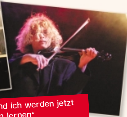
Hier ein Paganini-Solo – da eine Rap-Einlage: Beides auf hohem Niveau