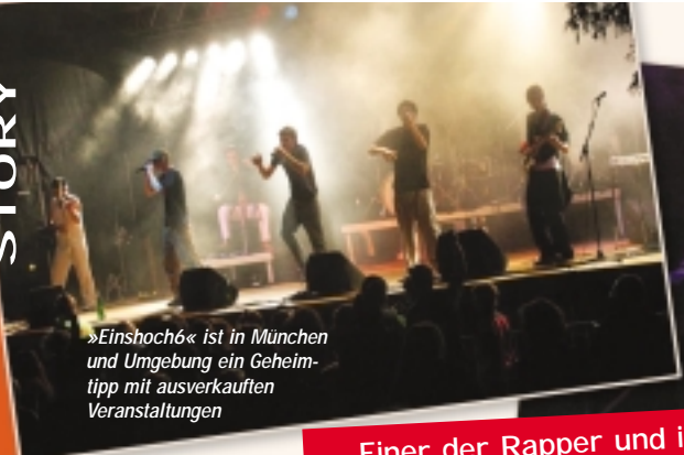
»Einshoch6« ist in München und Umgebung ein Geheimtipp mit ausverkauften Veranstaltungen